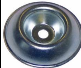
Protector tornillo (8 y 10mm)