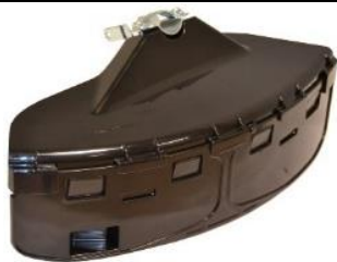
RD100 Protector barra (26 ó 28mm)