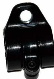
(26 y 28mm)