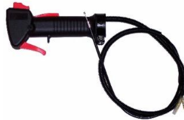
Mando gas desbrozador