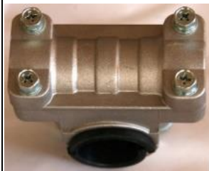
Soporte manillar desbrozador de 26 ó 28mm