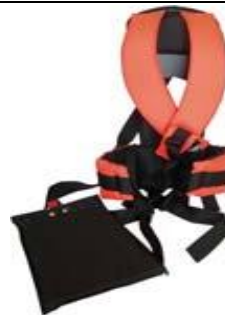
LUXURY Correaje profesional